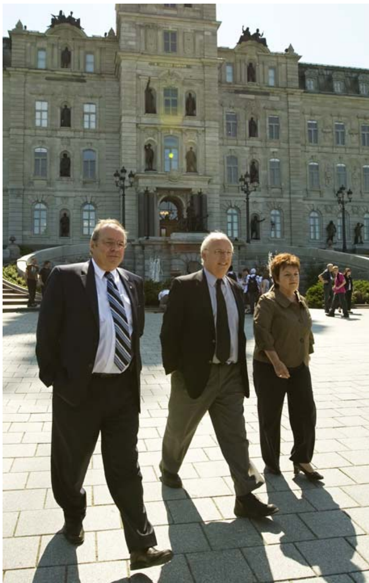
Charest en 2005.